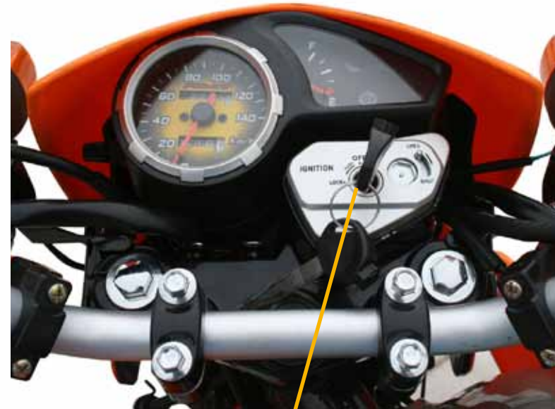
Llave de contacto